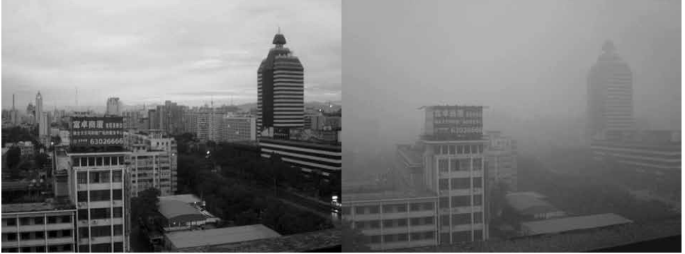
Beijing: klare Luft nach Regenfall und Smog bei sonnigem Wetter

Doch jenseits dieser juristischen Spitzfindigkeiten muss uns eines am allermeisten interessieren: Wie können wir es verhindern, dass eine Strategie zum Schutz für Milliarden heute und zukünftig lebender Menschen an der Steinzeitpolitik einer Regierung scheitert?