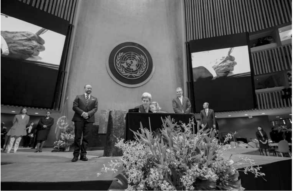
Symbolische Unterzeichnung des Pariser Klimaübereinkommens am Tag der Erde (22. April 2016) in New York durch US-Außenminister John Kerry (mit seiner Enkelin)

Wer hätte es für möglich gehalten, dass die Ablehnung eines Umweltvertrages (mit zugegeben starken wirtschaftlichen und sicherheitspolitischen Komponenten) die Akteure auf der internationalen Bühne neu ordnen würde? Dass die Forderung nach unbegrenzter Nutzung von Kohle und Öl ein Land zum Paria machen würde, mit unübersehbaren Schäden für dessen „soft power“ (und vielleicht bald auch der hard power) in den internationalen Beziehungen? Ja, dass die Gemeinsamkeiten in der Umweltpolitik sogar zu einem historischen Schulterschluss der Europäischen Union mit der Volksrepublik China führen würden? In diesem Sinne ist der Hype um die Entscheidung des US-Präsidenten durchaus zu begrüßen.