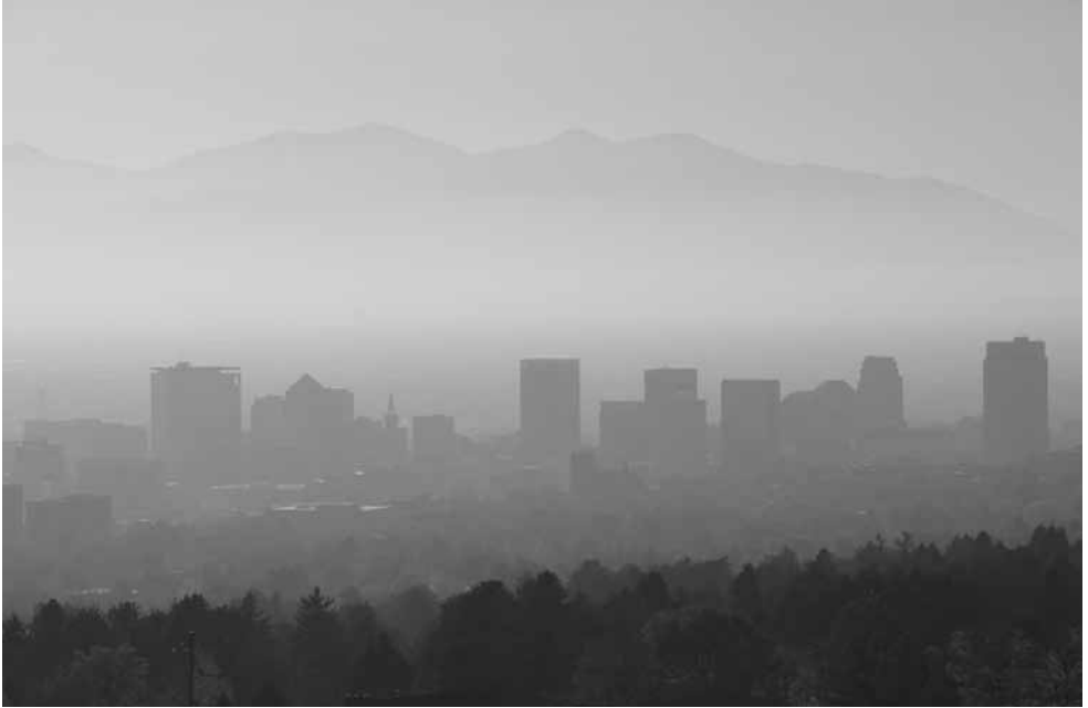
Smog und Dunst über dem Salt Lake Valley im November 2016

USA sind die schmerzende Wunde der globalen Klimadiplomatie seit deren Anfängen.