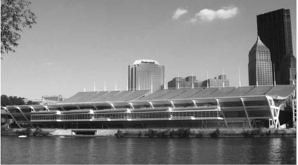
Das David L. Lawrence Convention Center in Pittsburgh, ein Musterbeispiel für den gelungenen Strukturwandel der ehemaligen Schwerindustriemetropole zu einer Erfinderstadt, die sich das Ziel gesetzt hat im Jahr 2035 ausschließlich „Clean Energy“ zu nutzen.

Es wäre auch aus einem weiteren Grund die Entscheidung mit dem größtmöglichen Schaden gewesen: Sie hätte die USA auf unabsehbare Dauer aus dem Klimaregime ferngehalten, weil es sehr unwahrscheinlich wäre, dass eine erneute Ratifizierung durch den Senat erfolgt. Die Kündigung des Pariser Klimaabkommens dagegen kann jederzeit durch eine einfache Erklärung des nächsten Präsidenten rückgängig gemacht werden.