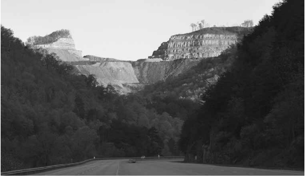
Mountaintop Removal mine in Pike County (Kentucky). Mountaintop removal mining ( dt. Bergbau durch Gipfelabsprengung) ist eine spezielle Form des Tagebaus in den USA. Der MTR-Kohleabbau führt zu erheblichen Eingriffen in Ökologie, Natur und Landschaft. Sie manifestieren sich vor allem in einer Veränderung des Landschaftsbildes – mit gravierenden Auswirkungen für Flora und Fauna – sowie die Grundwasserqualität. (wikimediacommons)

dem Senat gar nicht erst zur Ratifizierung vorlegte und so den Siechtod dieses ersten Vertrages einleitete.